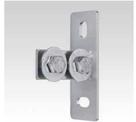
МРС-Торцовый фланец, продольное исполнение