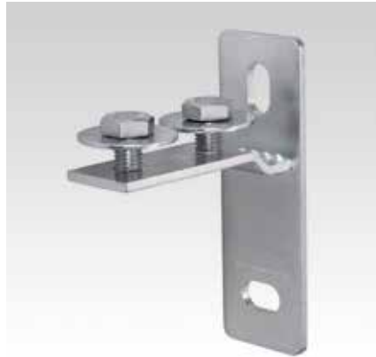
МРС-Торцовый фланец, поперечное исполнение