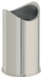
Модуль скрытого подключения для МЭМ «Сунержа» d 28мм арт. 00-1522-0028

Используя модуль скрытого подключения возможна установка электрического дизайн радиатора от компании «Сунержа» в нужном для вас месте без видимых проводов.