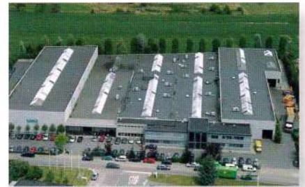
Завод по производству медных фитингов SANHA, Тернат, Бельгия

Первые резьбовые и пресс-фитинги из кремнистой бронзы без содержания свинца „pb-free“