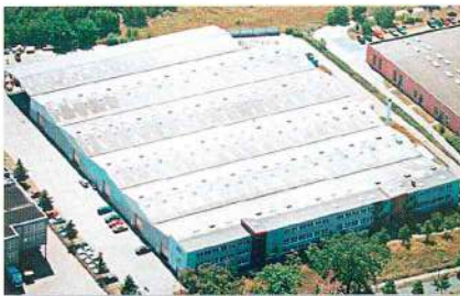
Завод по производству труб из нержавеющей стали NiroSan®, г. Берлин, Германия