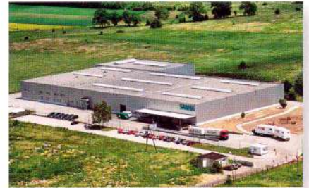
Производственно-логистический центр SANHA, Легница, Польша