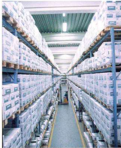
Центральный офис и логистический центр SANHA, г. Эссен, Германия