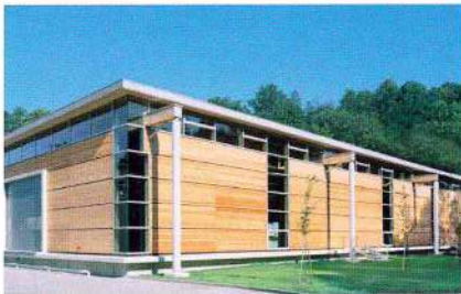
Завод по производству фитингов из нержавеющей и углеродистой стали NiroSan®-Press, г. Шмидефельд, Германия