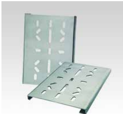
StaboFix® Фиксирующая пластина